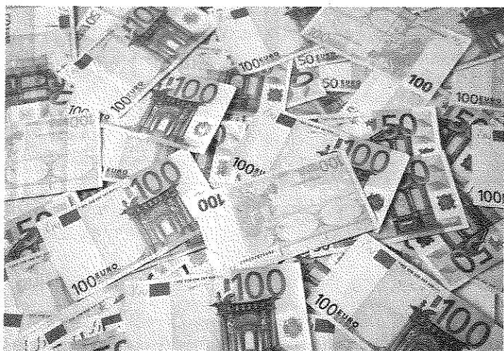
L'argent, le nerf de la guerre.