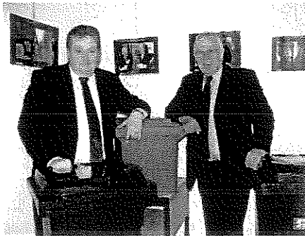
Intradel, au centre des discussions des élus anthinois!